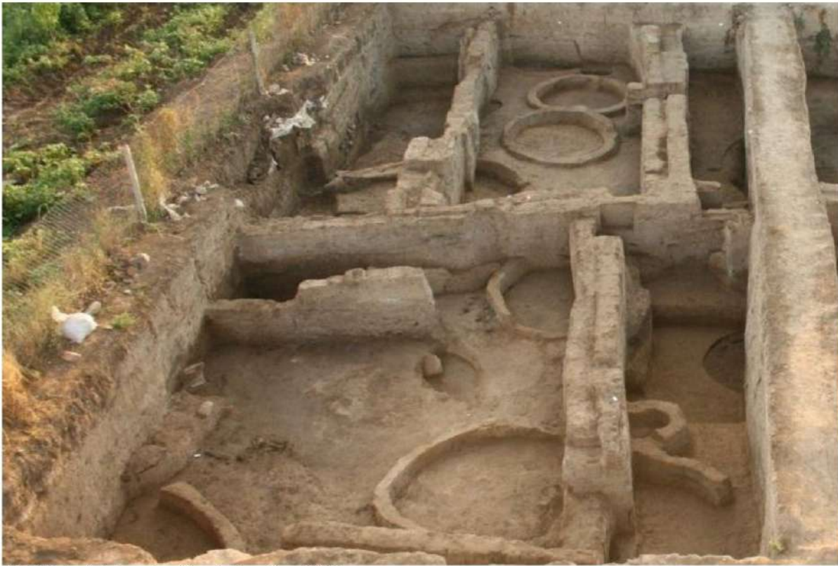
Şəkil 5. Aşağı təbəqədə mövcud olan dairəvi tikililər.

Qazıntı zamanı uşaq qəbirin aşkar edilmişdir. Bu qəbir dairəvi tikili divarının içəri hissəsi boyunca yerləşir lakin, digər bir dairəvi divar ilə örtülmüşdür. Burada heç bir çuxur aşkar edilməmiş və qəbirin üst hissəsi çox güman ki, ağac budaqları ilə örtülmüşdür, çünki, burada skeletin üst və ətraf hissələrində xeyli sayda həmin ağacın meyvələrinin çürüntüləri rast gəlinmişdir. Qəbir kamerasında baş tərəfdə donuzun çənə sümüyünün bir hissəsi ayaq tərəfində isə sümükdən biz alət aşkarlanaraq üzə çıxarılmışdır. Qeyd etmək lazımdır ki, Cənubi Qafqazda bu dövrlə bağlı qəbirlərin aşkar olunması çox nadir hadisədir. Sümüklər üzərində antropoloji analizlər aparılmışdır.