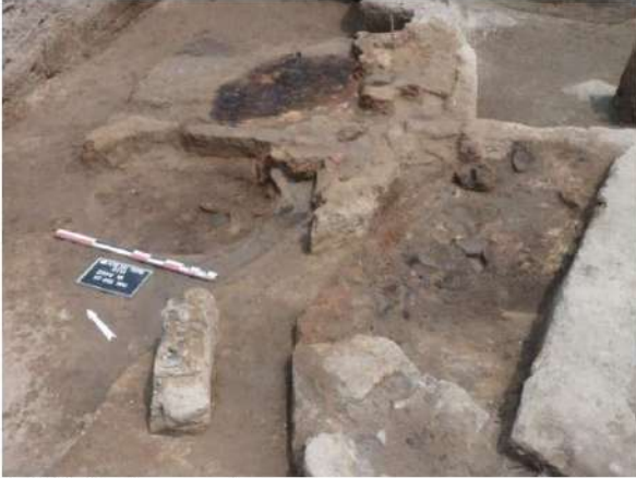
Şəkil 3. Üç iri ocaq yeri.