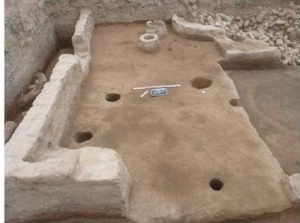
Şəkil 4. Çiy kərpic divarlarından ibarət düzbucaqlı tikili altında aşkar edilmiş üzərində sütun dirəkləri olan təbəqə.