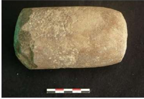
Şəkil 6. Həvəngdəstə.