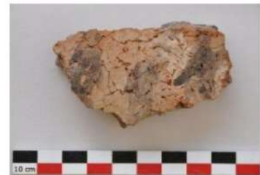
Şəkil 11. Alt təbəqədən aşkar edilmiş keramika nümunəsi.