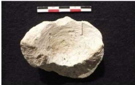
Şəkil 8. Əhəngdaşı.

56 ədəd dən daşları alətləri və onların arasında 15 ədəd əl üçün nəzərdə tutulmuş kiçik dən daşları və 27 ədəd bülöv daşı müəyyən edilmişdir. Qısa və bir tərəfi düz olan iki növdə dən daşları təyin edilmişdir. Onlar müxtəlif ölçülərdə və texnoloji cəhətdən çox fərqlilik nümayiş etdirir, lakin, onların funksiyasının və xronologiyasının fərqli olub olmadığı barədə hələ heç bir məlumatımız yoxdur. Əl üçün nəzərdə tutulmuş kiçik dən daşları adətən dən üyütmək üçün istifadə olunurdu.