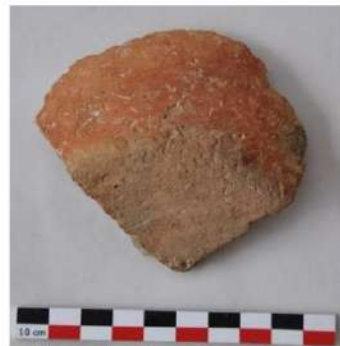
Şəkil 10. Alt təbəqədən aşkar edilmiş keramika nümunəsi.