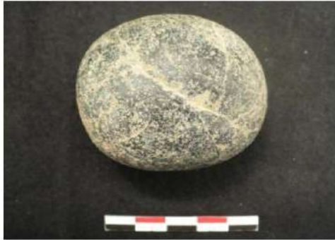
Şəkil 7. Cilalamaq və yonmaq üçün alət.