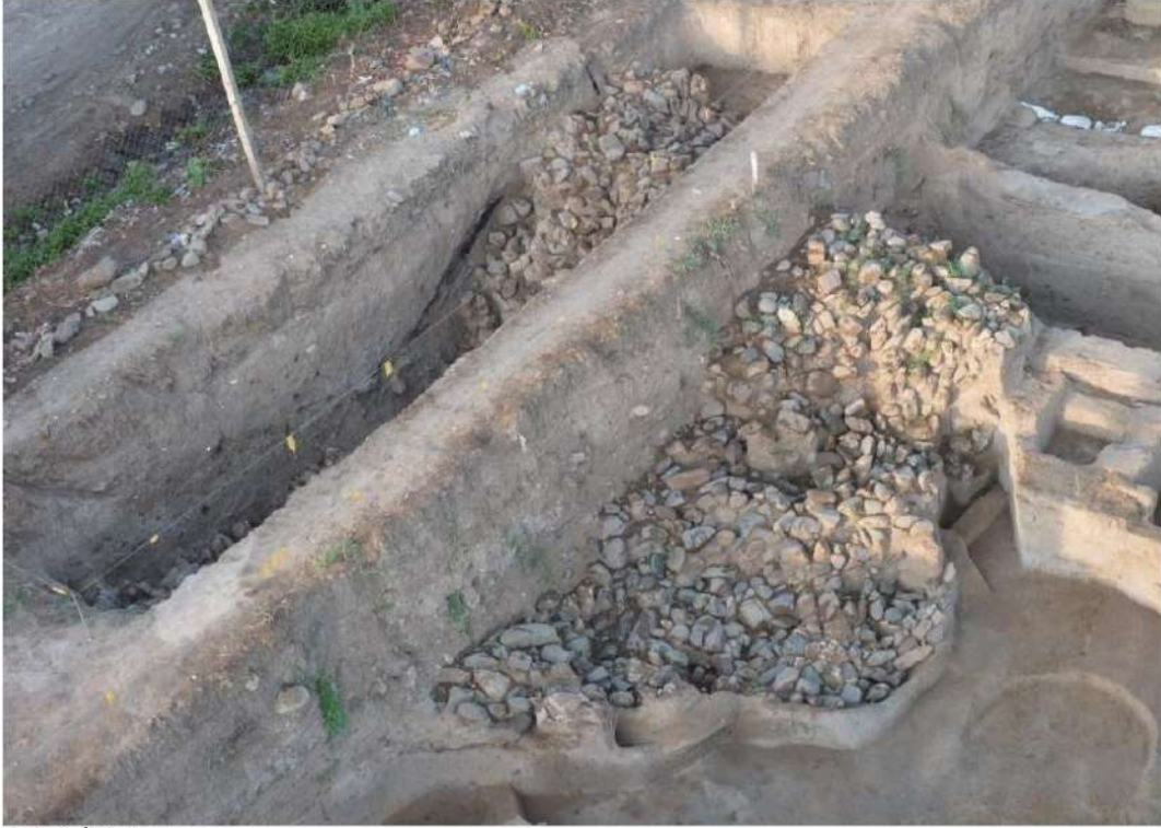
Şəkil 1. İkinci kurgan.