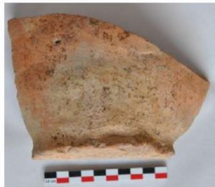
Şəkil 9. Alt təbəqədən aşkar edilmiş keramika nümunəsi.

Bu nümunələr iki cür qruplaşdırılır. Birinci qrup Şomutəpə–Şulaveri, ikinci qrup isə Əliköməktəpə ilə yəni Muğan Düzü ilə əlaqəlidir (şək. 9-10-11).