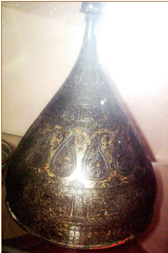
Şəkil 1. Sərpuş