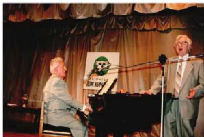
Smslov oxuyur, Taymanov çalır. 1998-ci il