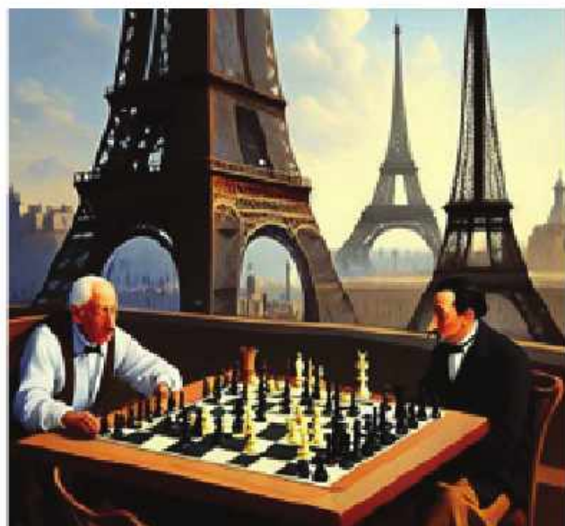
P. Picasso və S. Dali Parisdə

( https://sologenic.org/nfts/rGfHcoqB3PrVF4TsG21o3XcQAAtGK6U9QxY?network=mainnet )