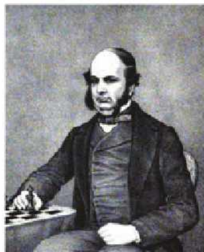
Henry Thomas Buckle

Görkəmli tarixçi və istedadlı şahmatçı Henry Thomas Buckle ("Bokl", 1821-1862) Staunton'un müasiri idi. Dövrünün güclü şahmatçılarını Lionel Kieseritsky (1805/6-1853), Loewenthal (1810-1876), Adolf Anderssen, D. Harrwitz və digər şahmatçılar üzərində qələbə çalmışdı. Staunton'la bir heç-heçə oyunu məlumdur. H.T. Buckle şahmatdan (rəsmi yarışlardan) aralanıb, özünü tarixə həsr etdi, "böyük tarixi əsər" üzərində çalışmağa başladı. Bu, onun şah əsəri olan "History of Civilization in England" idi (1-ci cild, 1857 və 2-ci cild, 1861). Buckle bu tarix kitabını 14 cild olaraq planlamışdı. O, tarixyazma və tarix fəlsəfəsinə aid maraqlı fikirlər irəli sürmüşdü. Deyilənə görə, öləndə son sözləri: "Mənim kitabım, mənim kitabım, onu heç vaxt bitirə bilməyəcəm" olmuşdu (James Anthony Froude. Short Studies On Great Subjects. Outlook Verlag GmbH,