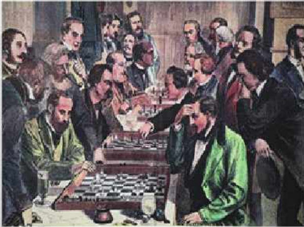
4-cü cütdə, sağda Turgenev