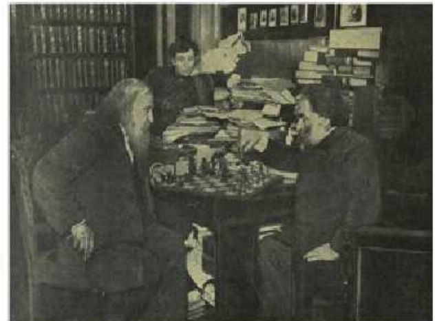
Mendeleev və Kuindji şahmat oynayırılar