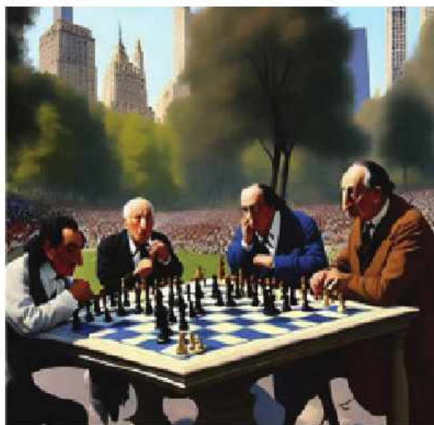
P. Picasso və S. Dali Nyu-Yorkda

Fransız M. Duchamp və onun həmkarları, dost və rəqibləri iki ispaniyalı – Pablo Picasso (1881-1973) və Salvador Dali (1904-1989) 20-ci əsr rəsm sənətinin nəhəngləri, radikal üslub sahibləri olmaqla neoklassik, modernist, kubist, sürrealist və s. cərəyan liderləri olaraq heykəltəraşlıq, dizayn və digər sənət sahələrinə də böyük töhfələr vermiş və populyar mədəniyyət ulduzlarına çevrilmişdilər. M. Duchamp qədər olmasa da, P. Picasso və S. Dali də şahmatı sevməklə yanaşı öz çoxtərəfli, rəngarəng yaradıcı sənət fəaiyyətlərində şahmatdan təsirlənən və şahmatdan yaradıcı ilham alan rəssam sayılırlar. S. Dali və Picasso sənət əsəri olaraq şahmat dəsti, şahmat fiqurları düzəldirdilər. Delakrua və