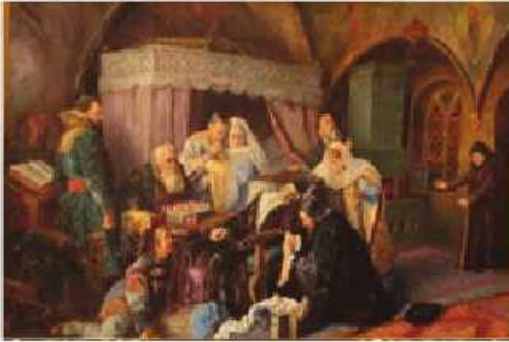
IV İvan. Müəllif: Konstantin Makovskiy. Şəkil 2014-cü ildə bir Moskva özəl qalereyasından oğurlanıb