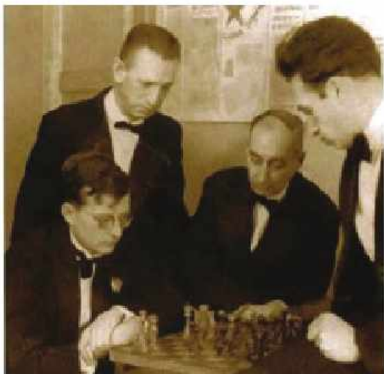
Şostakoviç şahmat oynayır

Şahmatı çox sevən, şahmat oynayan məşhurların sadəcə adlarını çəkmək belə mümkünsüz işdir. Bu istiqamətdə kim nə qədər uzun yazsa da, yarımqıç olacaq. Göstərdiyim adlarla kifayətlənirəm.