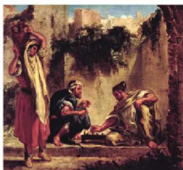
Delakrua: Şahmat oynayan ərəblər