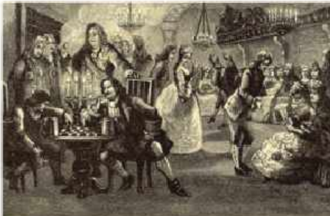
1-ci Pyotr şahmat oynayır

İslam dünyasından gələn şahmat Rusiyada maraqla qarşılandı. Rus çarları 4-cü İvan Qroznu (1530-1584), 1-ci Pyotr (1672-1725), bolşeviklərin lideri və Sovet hökumətinin ilk rəhbəri V.İ. Lenin (1870-1924) şahmatı sevir, şahmat oynayırdılar.