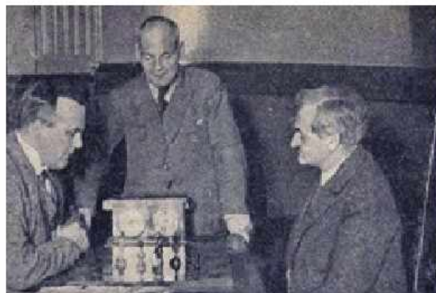
Lasker, E.D. Boqolyubov və N. Krilenko

N. Krilenko'nun yüksək hökumət işi ilə yanaşı, sevimli hobbiləri vardı – birinci növbədə şahmat və alpinizm, həmçinin ovçuluq. Pamir dağlarında iki dəfə zirvə fəth edən, o cümlədən Lenin zirvəsinə qalxan komandada olmuş, "əməkdar alpinizm ustası" adına layiq görülmüşdü (1935). O, Lenin, Kalinin və Frunze ilə şahmat oynamışdır. N. Krilenko öz iş kabinetində saatla şahmat oynayır, şahmat partiyalarını təhlil edir, məsələ və etüd həll edirdi. M. Botvinnik N. Krilenkonun Sovet şahmat həyatında inqilab etdiyini, oyunun kütləviləşməsi və şahmatın böyük inkişafı naminə çalışdığını, yüksək təşkilatçılıq istedadına malik olduğunu deyirdi. 1925-ci ildə N. Krilenko'nun təşəbbüsü ilə Moskvada Beynəlxalq Şahmat Turniri keçirildi. Keçmiş Dünya çempionu E. Lasker, fəaliyyətdə olan dünya çempionu Kapablanka və digər görkəmli şahmat ustalarının iştirak etdiyi bu turnir tarixdə ən çox təbliğ olunan və təsir buraxan şahmat yarışlarından biri, bəlkə də birincisi oldu. "Şahmat qızdırması" (Шахматная горячка) ölkəni bürümüşdü. Sonra yenə də Krilenkonun birbaşa təşəbbüsü ilə Moskvada yenə Lasker və Kapablanka'nın iştirakı ilə daha iki Beynəlxalq Şahmat Turniri keçirildi (1935, 1936).