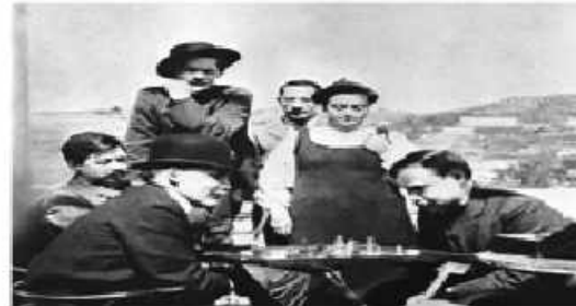
Lenin, M. Qorki və Leninin inqilabçı həmkarı A. Boqdanov Kapri adasında şahmat oynayırlar (1908)

İslam dünyasından gələn şahmat Rusiyada maraqla qarşılandı. Rus çarları 4-cü İvan Qroznu (1530-1584), 1-ci Pyotr (1672-1725), bolşeviklərin lideri və Sovet hökumətinin ilk rəhbəri V.İ. Lenin (1870-1924) şahmatı sevir, şahmat oynayırdılar.