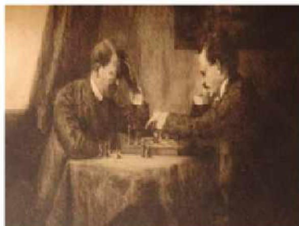
Lenin və Hitler (saxta şəkil)

A.S. Puşkinin yaxın dostu məşhur elektrotexnik,