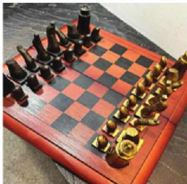
S. Dalinin düzəldiyi (M. Duchamp'ın dəvəti ilə) bürünc şahmat fiqurları

digər tarınmış rəssamlar da şahmat mövzusunda müraciət etmişdilər.