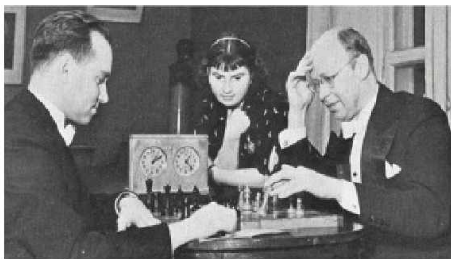
S. Prokofyev və David F. Oystraxt

"Şahmat beynin musiqisidir" (шахматы – музыка мозга) deyən digər böyük rus bəstəkarı D. Şostakoviç də şahmatı çox sevirdi.