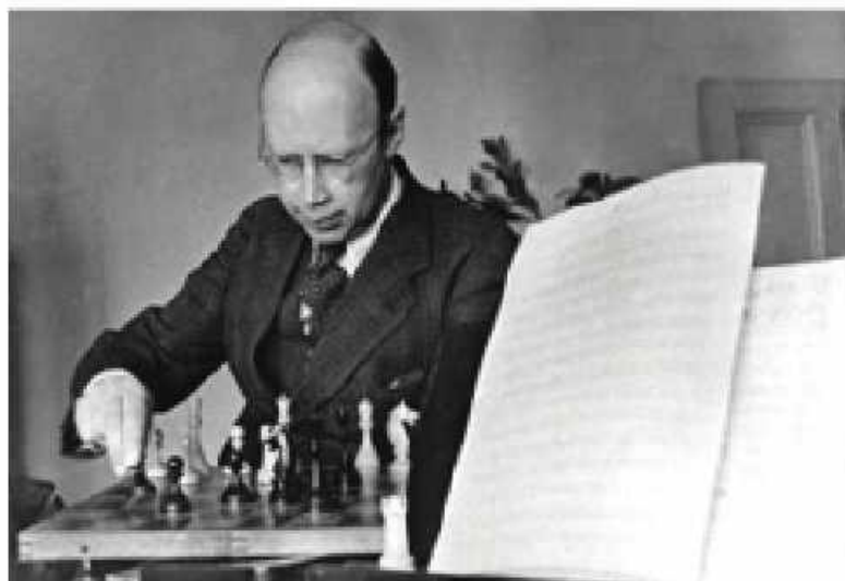
S. Prokofyev şahmat taxtası arxasında

"Şahmat düşüncənin musiqisidir" (шахматы – эта – музыка мысли) deyən böyük bəstəkar şahmatçı və bəstəkar arasında maraqlı bənzərlik görürdü: "Mürəkkəb, dərin Lasker mənə əzəmətli Bax kimi görünürsə, canlı, cəld Kapablanka elə Kapablanka kimi rahatlıqla, bəzən də xoş zərifliklə yarıdan əbədi gənc Motsartı xatırladır".