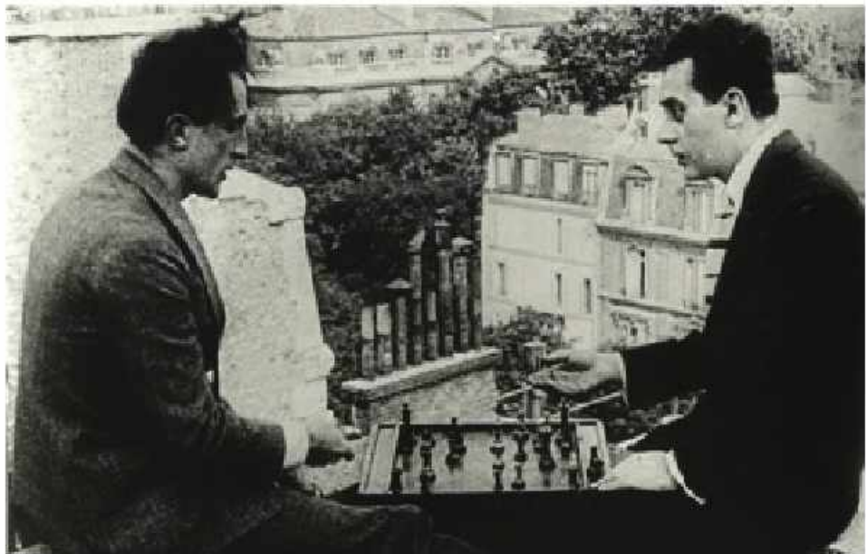
Marcel Duchamp və Man Ray Parisdə Champs Elysées teatrının damında şahmat oynayırlar

fəlsəfə öyrənir, texniki (kinetik) heykəltəraşlıqla məşğul olur, musiqi yazırdı. 1918-ci ildə çox şahmat oynayırdı və get-gedə rəsmi buraxıb vaxtını şahmata həsr etməyə başladı, güclü şahmatçıya çevrildi. Şahmata aid rəsmləri mövcuddur. O, Fransa çempionatlarında və şahmat olimpiadalarında oynadı. Şahmatda zirvələrə yüksələ bilməyəcəyini anladı, amma, yenə də, şahmatla yaşayırdı, şahmat jurnalistinə çevrilmişdi. Şahmatın qeyri-adi gözəlliyi onu valeh etmiş, onu dünyada tanıdan əsas məşğələsindən uzaqlaşdırmışdı: "Mən hələ də şahmatın qurbanıyam. O, sənətin bütün gözəlliyinə malikdir – artıqlamasıyla". Şahmatı