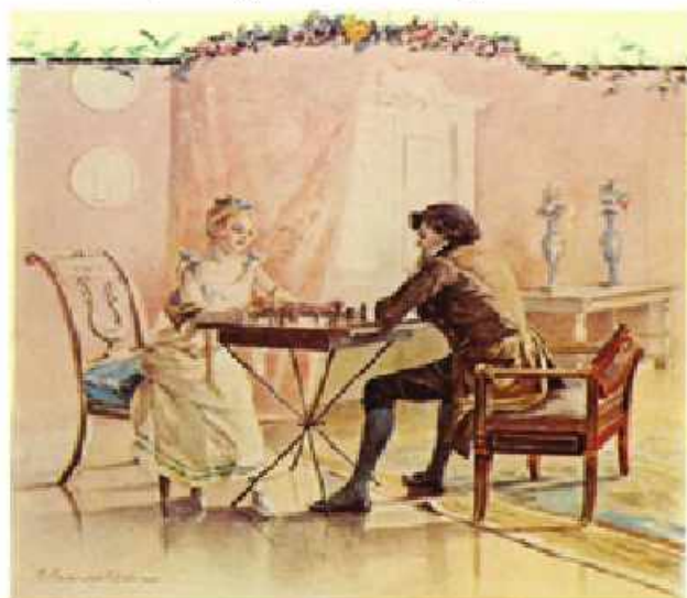
Vladimir Lenskiy və Olqa Larina şahmat oynayırlar