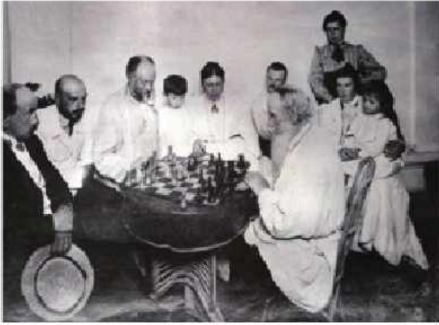
Lev Tolstoy M.S. Suxotinlə şahmat oynayır

həvəskar" olduğu deyilir. Əksər həmkarlarından, o cümlədən Lev Tolstoydan güclü imiş. Tolstoyun oğlu Sergey də buna şahidlik edir. 1862-ci ildə La Regence kafesində oynanılan 64 nəfərlik bir turnirdə 2-ci yeri tutmuşdu. Turgenev əvvəl oynaya-oynaya öyrənmiş, sonra kitab oxumaq və çoxsaylı şahmat partiyalarını təhlil etməklə güclənmişdi.