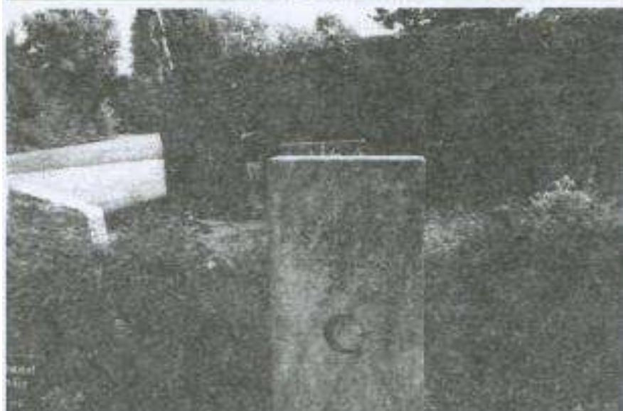
Azərbaycan legionerlərinin Almaniyaadakı məzarları