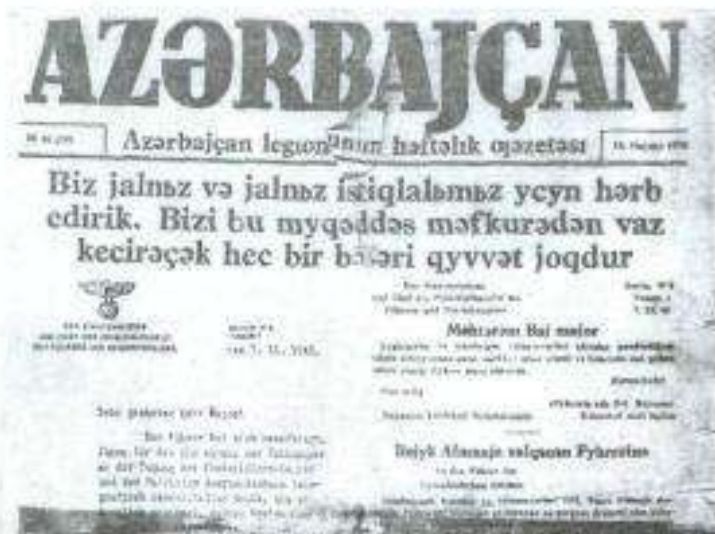
Azərbaycan legionerlərinin nəşr etdiyi Azərbaycan qəzeti