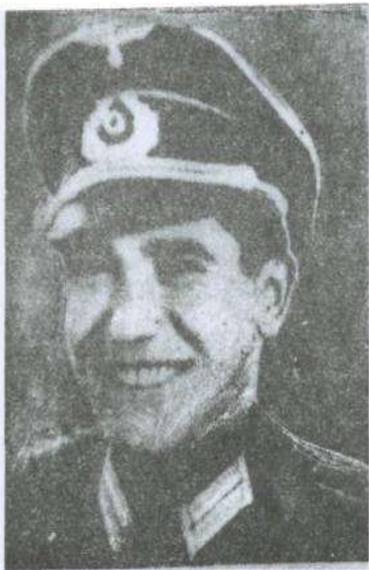
Mayor Əbdürrəhman bəy FƏTƏLİBƏYLİ - DÜDƏNGİNSKİ