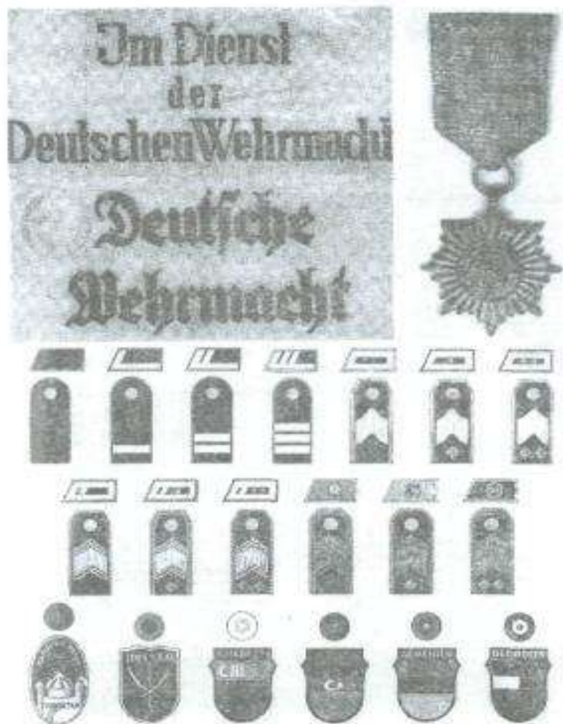
Şəkildə: Legionerlərin qol sarğuları, təltif medalı və rütbə nişanları