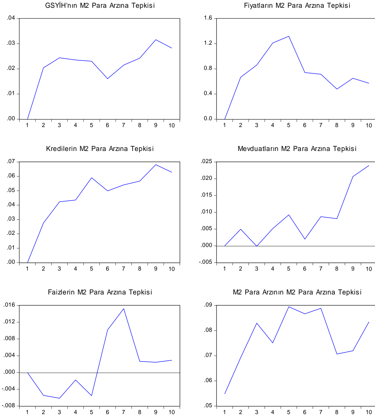
Grafik 1. Cholesky Yöntemine Göre Bir Standart Sapmalı Para Arzı ( M_2 ) Şokuna Değişkenlerin Tepkileri

güven aralığında Cholesky yöntemine göre 10 dönemlik (üçer aylık verilerle çalışıldığından 2.5 yıllık) etki-tepki fonksiyonları hesaplanmış ve grafikleri çizdirilmiştir. Sonuçlar Grafik 1 ve Grafik 2’de sunulmaktadır. Grafik 1’de, para politikası değişkeni olarak seçilen M_2 para arzının hata terimlerinde meydana gelen 1 standart hatalık genelleştirilmiş etkisine diğer değişkenlerin gösterdiği tepkiler analiz edilirken; Grafik 2’de ise, kredilerin hata terimlerinde meydana gelen 1 standart hatalık genelleştirilmiş etkisine diğer değişkenlerin verdiği tepkiler araştırılmıştır.