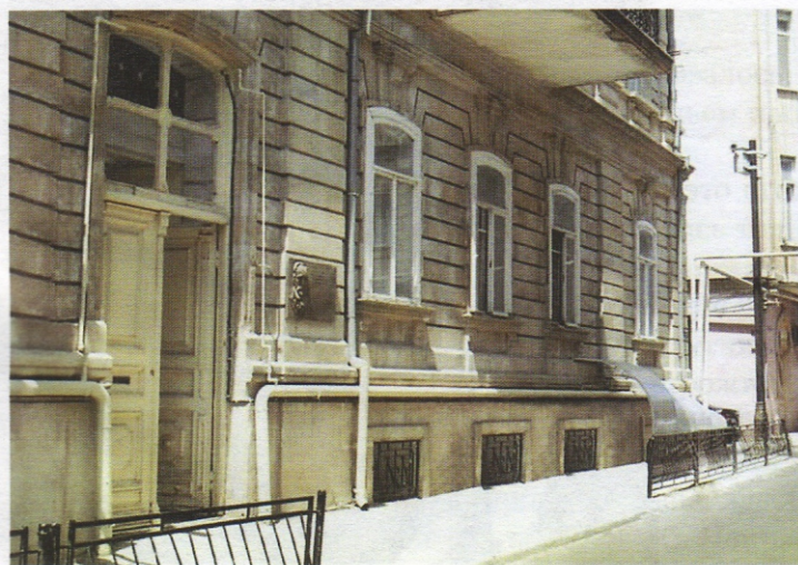
Дом № 11 по адресу: г. Баку, ул. Ибрагимова (бывшая М. Горького), где жил Ф.С. Непряхин — член литературного кружка рабочих поэтов и писателей при газете «Бакинский рабочий». Летом 1925 года Есенин несколько раз бывал здесь