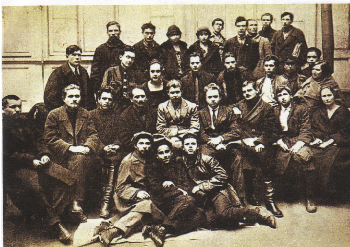
Есенин (в центре) с членами литературного кружка рабочих поэтов и писателей при газете «Бакинский рабочий». Справа от него П. Чагин, слева — Е. Гурвич. Во втором ряду слева (первый) — Ф. Непряхин. Баку, апрель 1925 г.