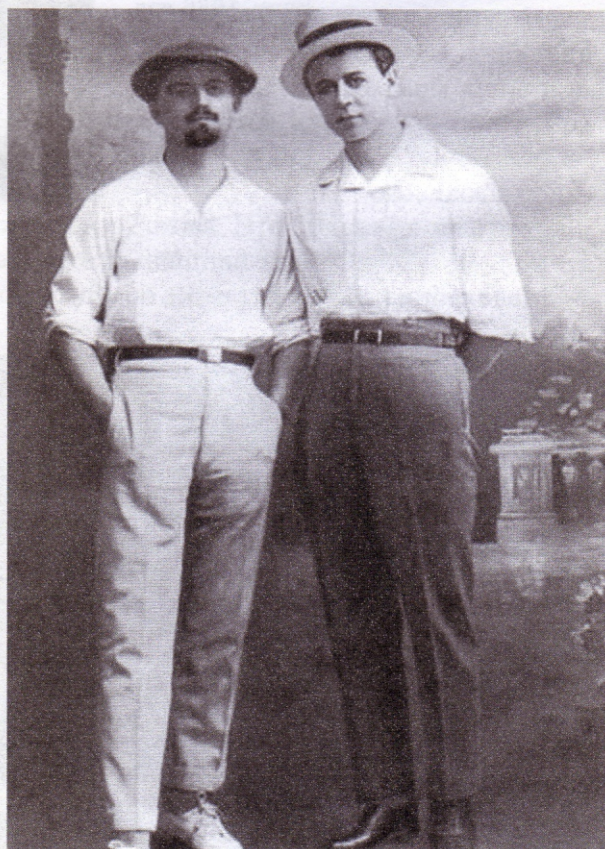
Сергей Есенин и Василий Болдовкин (г. Баку, 24 мая 1925 г.)