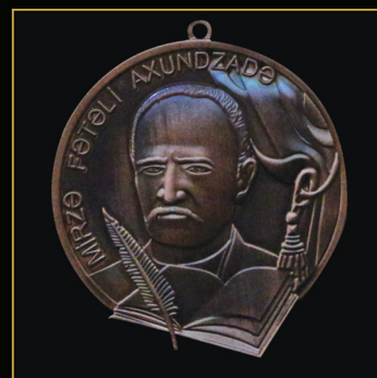
Mirza Fatali Akhundov Medal