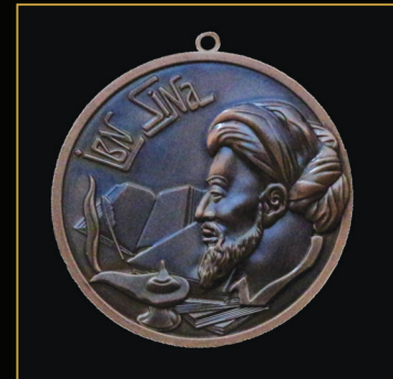
İbn Sina adına medal