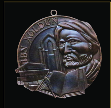
İbn Xəldun adına medal