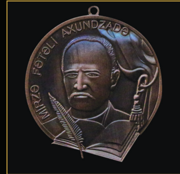
Mirzə Fətəli Axundzadə adına medal