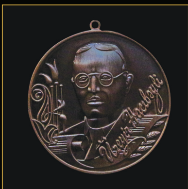
Üzeyir Hacıbəyli adına medal