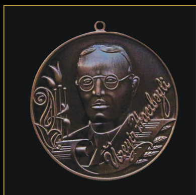
Uzeyir Hajibeyli Medal

The idea to establish Eurasian Academy was the result of discussions and consultations starting in 2012. A final decision was made about who would be included in the list of founding members.