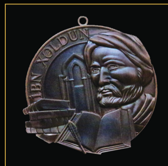
Ibn Khaldun Medal