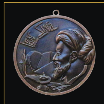
Ibn Sina Medal