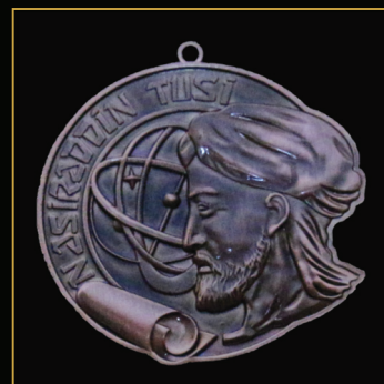
Nasiraddin Tusi Medal

"PASS ALONG MY GREETINGS AND LOVE TO BAKU"