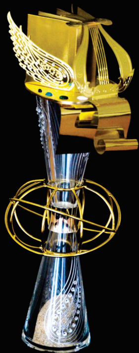
“Avrasiya Əfsanəsi” kuboku