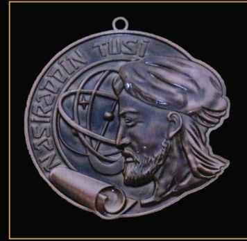
Nəsirəddin Tusi adına medal