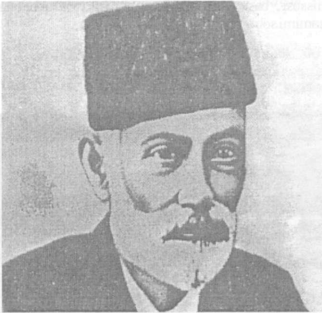
Həsən bəy Məlikov-Zərdabi

Həsən bəy Məlikov-Zərdabi (1842-1907), Tiflisdə gimnaziya oxumuş, oranı bitirdikdən sonra 1861-ci ildə Moskva Universitetinə daxil olmuş və 1865-ci ildə fizika-riyaziyyat fakültəsinin təbiət elmləri bölməsini bitirmişdir. Moskvada qalib elmi-tədqiqatla məşğul olmaq təklifi olsa da, Azərbaycana qayıtmağı üstün tutmuş, vətəninə geniş maarifçilik