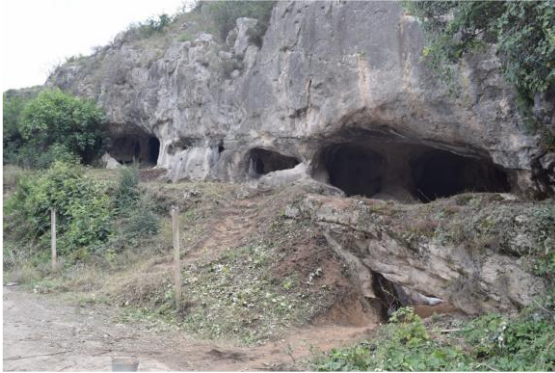
Şəkil 1. Tağlar mağarasının ümumi görünüşü