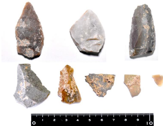
Şəkil 3. Tağlar mağarasından orta paleolit dövrünə aid daş artefaktlar