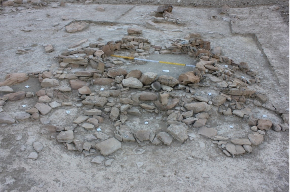
Şəkil 1. III Plovdağ nekropolunda kult təyinatlı dini kompleksin mərkəzi tikilisi.

plekslər ya nekropolların kənarında, ya da nekropolla yaşayış yerinin arasında yerləşmişdir.