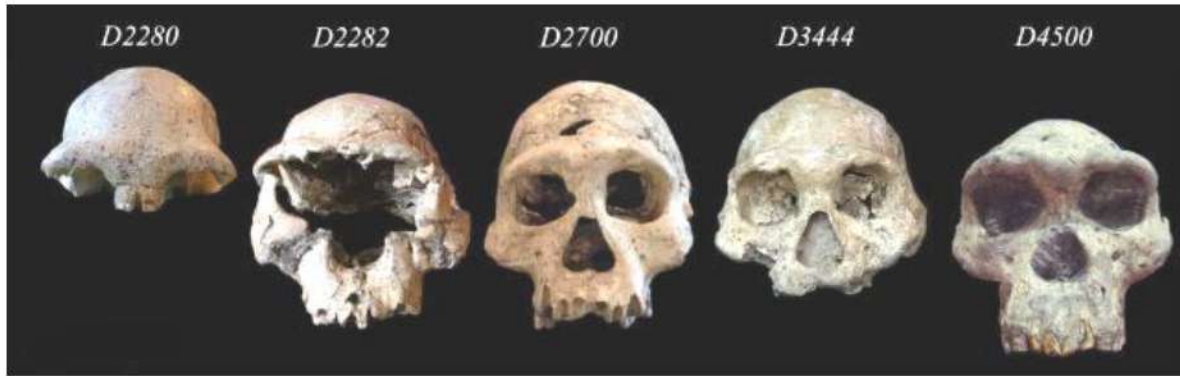
Səkil 1. Dmanisi məskənindən aşkar olunmuş kəllələr