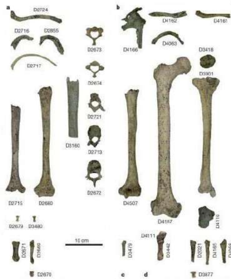
Səkil 3. Dmanisi məskənindən aşkar olunmuş postkranial sümütlər.