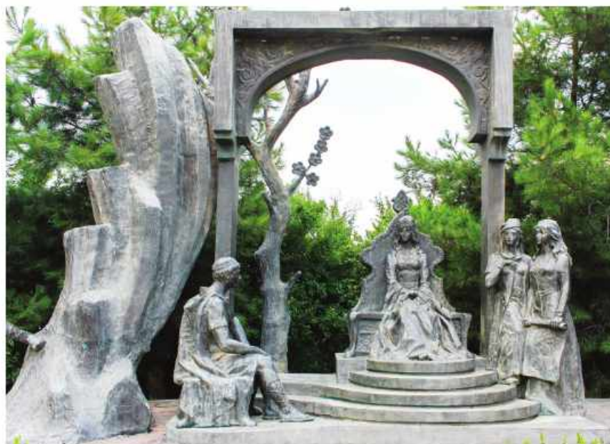
Gəncədə Nizami məqbərəsi yanında Nüşabə və İsgəndər heykəli

Sinəsi yasəmən, baldırı gümüş qızlar Hər işdə onunla birgə olarlar (3386). Bütün işləri qadınlara tapşırmışdı, Kişiləri görməyə ehtiyac duymurdu (3372).