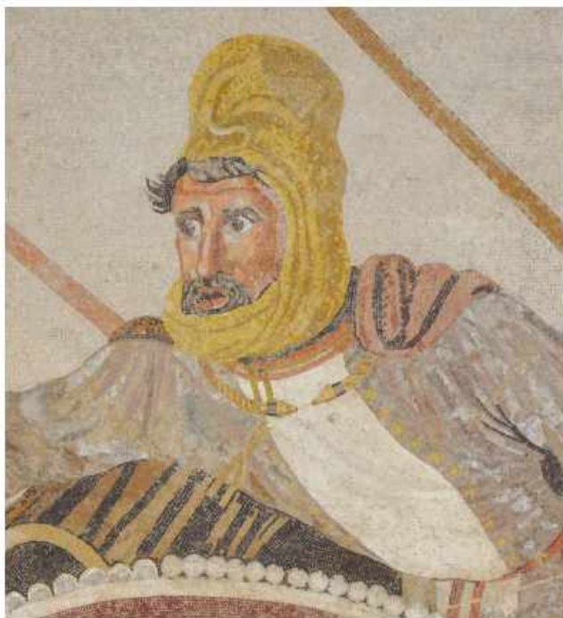
İran hökmdarı Dara. Qədim Roma şəhəri Pompeyda "Faun evi"ndə mozaika

Və bu tərifin canı olaraq hökmdara "Ürək sənən" və "Sənin vilayətin isə o məmləkətin özəyidir" (359) deyir. Lakin, Nizami, Firdovsidən fərqli olaraq, İranın əfsanəvi və qəhrəmanlıq dövrlərinə xüsusi müraciət etmir, üstəlik, İran şahlarına, o cümlədən, öz qəhrəmanları Bəhram Gur və Xosrov Ənuşirvana pərəstiş etmir, əksinə onları danlayır, qadın qəhrəmanlarının dili ilə onları elm və mərifət öyrənməyə və ədalətə çağırır. Nizami baş, ideal qəhrəmanı olaraq yunan əsilli İsgəndəri – Makedoniyalı Aleksandri seçir, daha doğrusu, yaradır.