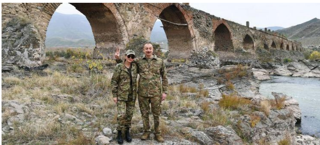
Azərbaycan Respublikasının Prezidenti Cənab İlham Əliyev və birinci xanım Mehriban Əliyeva işğaldan azad edilmiş Xudafərin körpüsünün önündə ( https://president.az/articles/46840 )