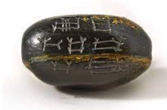
Şəkil 2. Xocalı nekropolunda 11 sayılı kurqandan tapılmış, üzərində Assuriya hökmdarı III Adadnirarinin adı yazılmış muncuq.