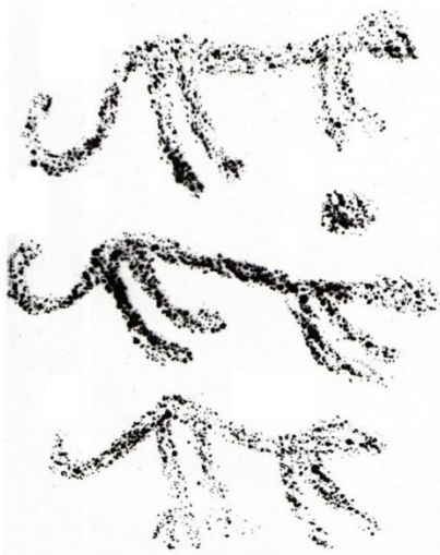
Şəkil 3. Kəlbəcər qayaüstü təsvirlərindən nümunə.