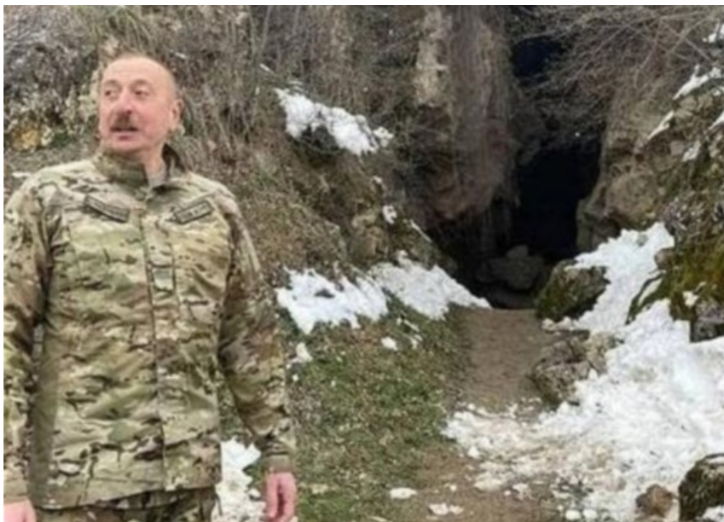
Azərbaycan Respublikasının Prezidenti Cənab İlham Əliyev işğaldan azad edilmiş Azıx mağarasının önündə