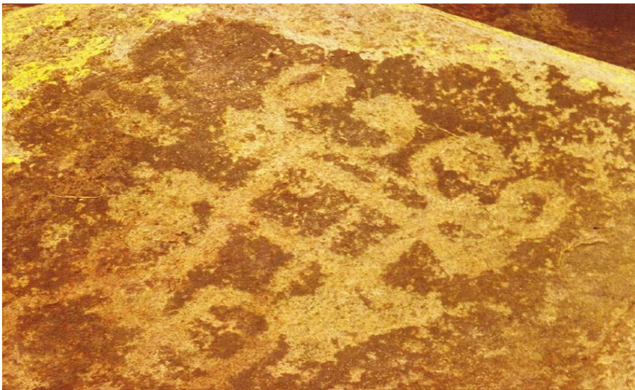
Şəkil 4. Kəlbəcər qayaüstü təsvirlərindən nümunələr