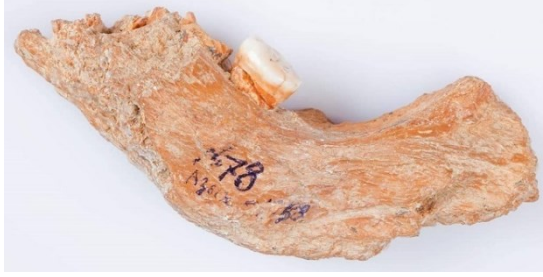
Şəkil 1. Azıx mağarasından aşkarlanmış alt çənə sümüyü ( https://science.gov.az/az/news/open/16024 ).