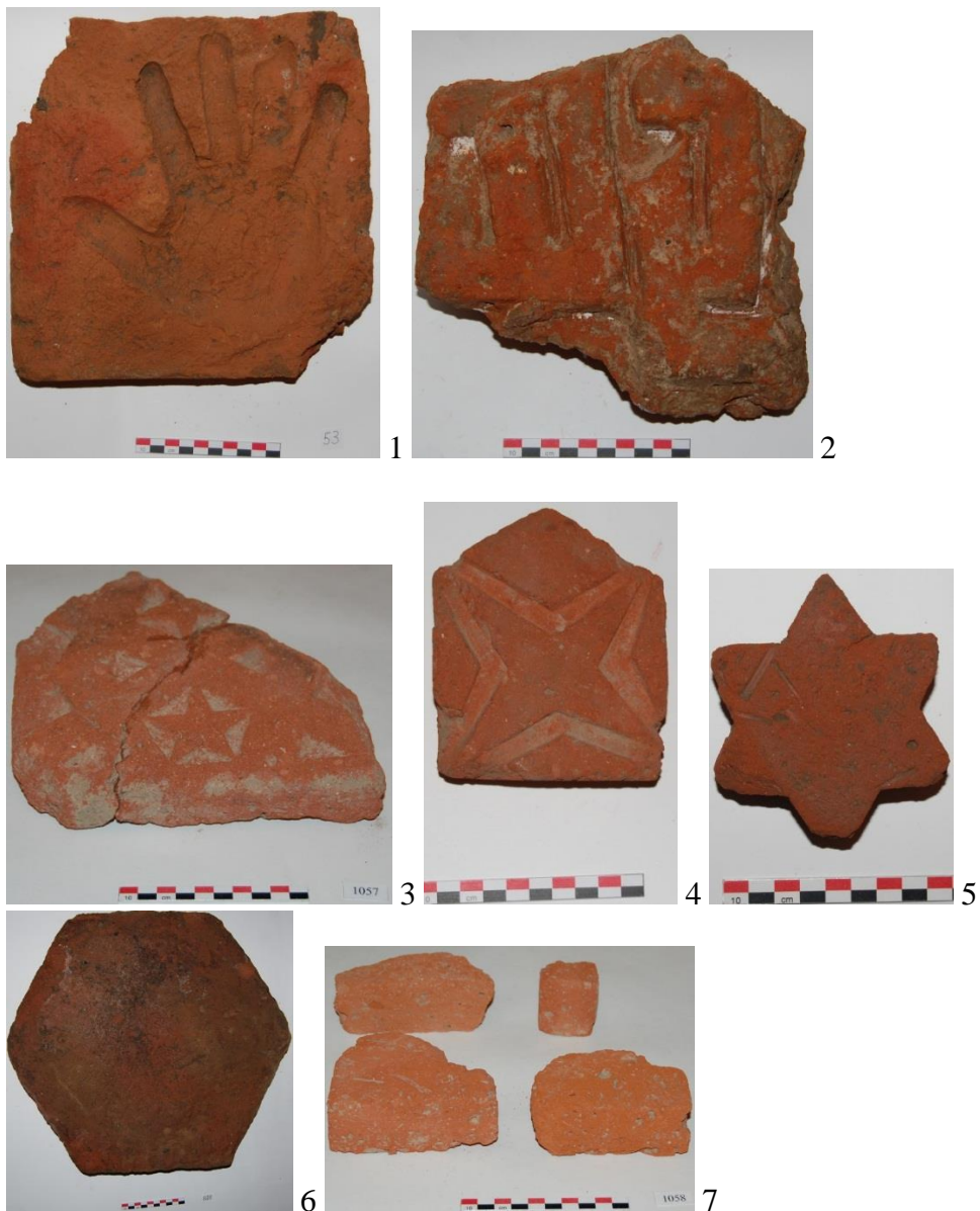
I tablo. 1-Üzərində insan əlinin əksi olan kərpic; 2- Üzərində kitabə olan kərpic; 3-5,7 – bəzək kərpicləri; 6- altıkünclü, böyük ölçülü kərpic