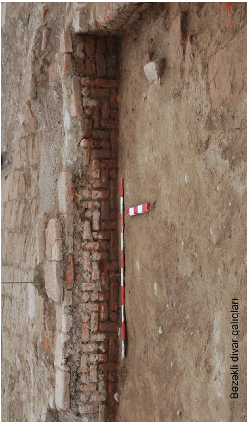
B z kli divar qalıqları