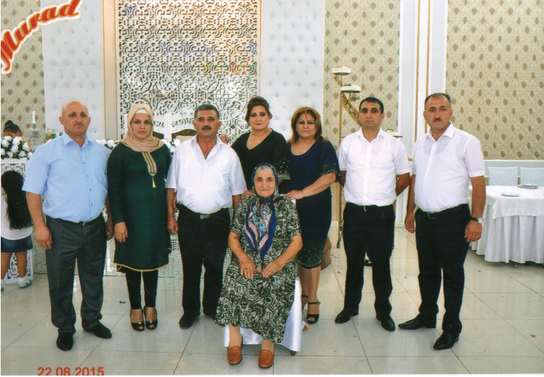
Elman beyin xanımının ailəsi