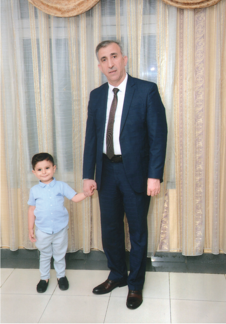
Elman bəy nəvəsi ilə