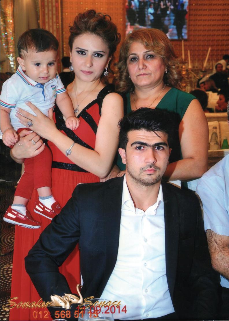
Elman bəyin ailəsi