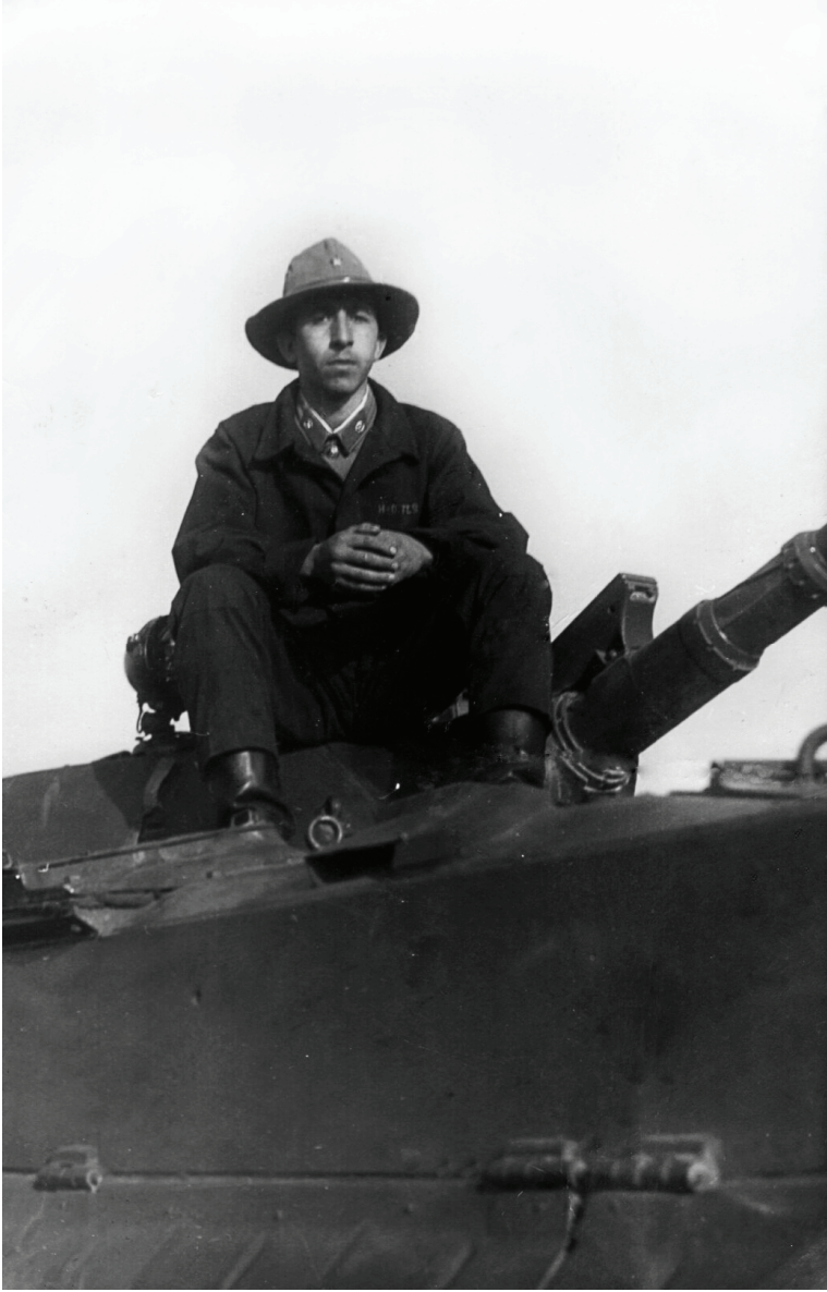
Elman bəy döyüş zamanı