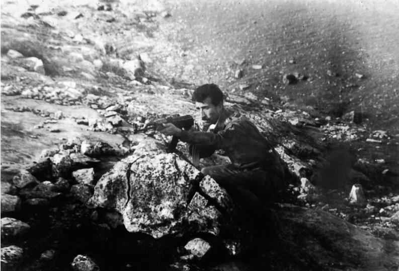
Elman bəy döyüşdə