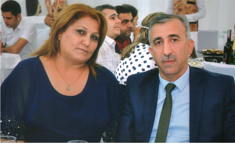
Elmanın xanımı K n l