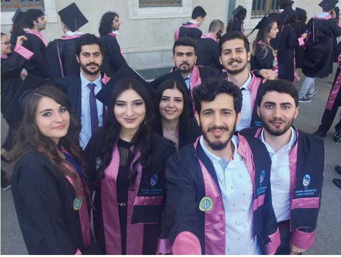
Ođlu dostları ve tælæbe yoldařları ile