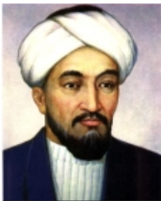
Əbu Nəsr əl-Fərabî