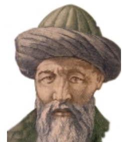
Yusuf Xas Hacib Balasaqunlu

Yusuf Xas Hacib Balasaqunlu (1015/19-1077/85) “Kutadqu biliq” və ya “Qutadqu biliq” (xoşbəxt edən və ya səadət verən bilik-elm) 1069/70-ci illərdə əruz vəznində türkcə (“xan tilinçə”) yazılmış sanballı epik-fəlsəfi poeması ilə tanınır. Əsərdə quta, yəni xoşbəxtliyə, səadətə sahib olma yollarından, ideal dövlətdən bəhs edilir. “Kutadqu biliq” sözünü dövlət quran bilgi, şahənə bilgi, hökmlərlik bilgisi kimi də şərh edirlər. Əsər şərqi Qaraxanlı hökmdarı Tavqaç Uluğ Buğra Qaraxana (1058-1103) ithaf edilmişdir. “Kutadqu biliq” qədim türk ədəbiyyatının son böyük əsəri olmaqla, İslam və İran mədəniyyətinə nisbətən yeni daxil