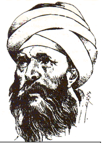
Əbu Həmid əl-Qəzali

(1058-1111), latınca Algazel kimi tanınan mütəfəkkir İslam düşüncəsi və mədəniyyəti tarixində fəlsəfə ilə təsəvvüfü (sufizmi) bir-birinə yaxınlaşdırmağa cəhd edən, yunan fəlsəfəsi üzərində qurulan fəlsəfəyə qarşı şübhəçiliyi və tənqidi ilə fəlsəfə və din tarixində çox böyük yer tutur. “Duyğularımın məni aldatdığını ağıl hökm etdi. Ağılın da məni aldatmadığına necə əmin ola bilərim?” Dini elmlərlə əqli elm-